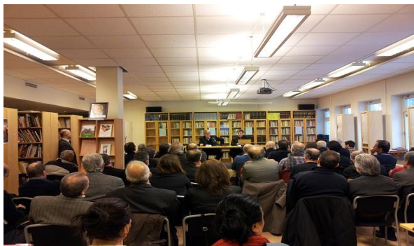
Kurdiska skrivregler, bok och lexikon, 9 feb