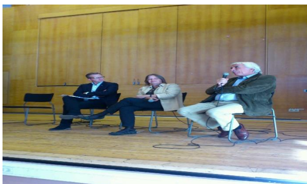
Tio år efter Anna Lindh, Tensta Träff, 1 sept