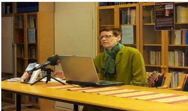
Boken "The Kurds: a nation of genocides", 11 maj