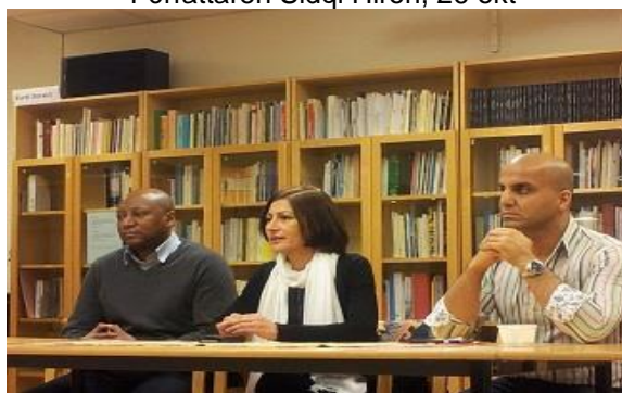
Våldet hemma, 23 nov