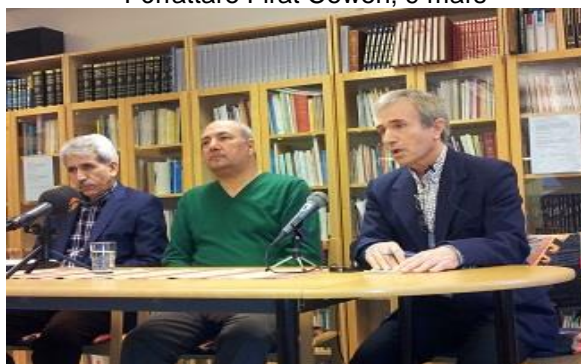
Kurdiska pressdagen, 22 april