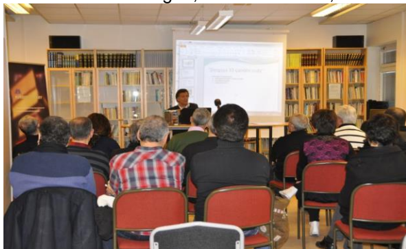
Boken "Amed", 2 mars