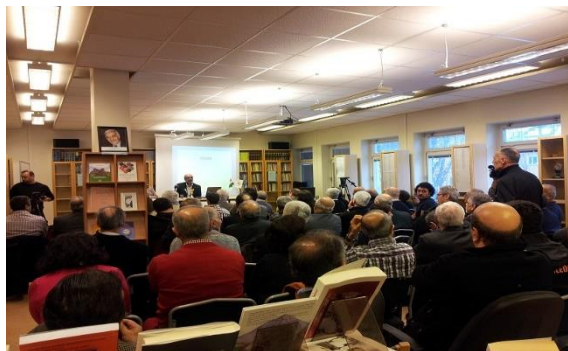
Kurdiskt digitalarkiv, 17 feb