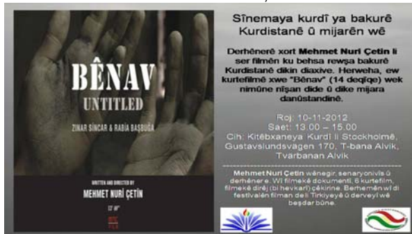
Kurdiska filmer om norra Kurdistan, 10 nov