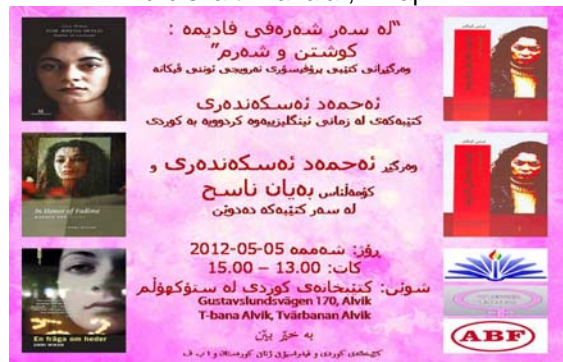
Boken "For ærens skyld: Fadime til ettertanke" av Unni Vikan i kurdisk översättning, 5 maj