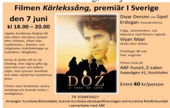
Filmen Kärlekensång, 7 juni