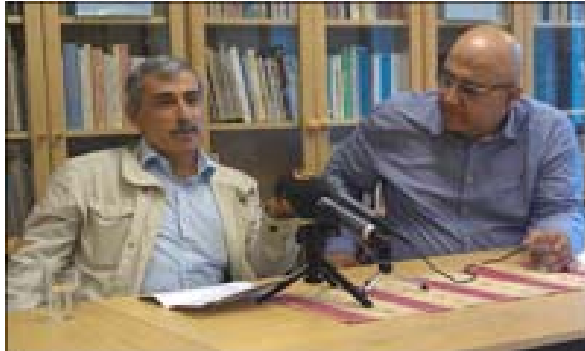
Översättning till kurdiska, 9 juni