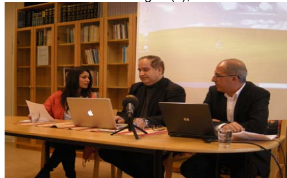
Kurdiska tv-kanalar, 22 april