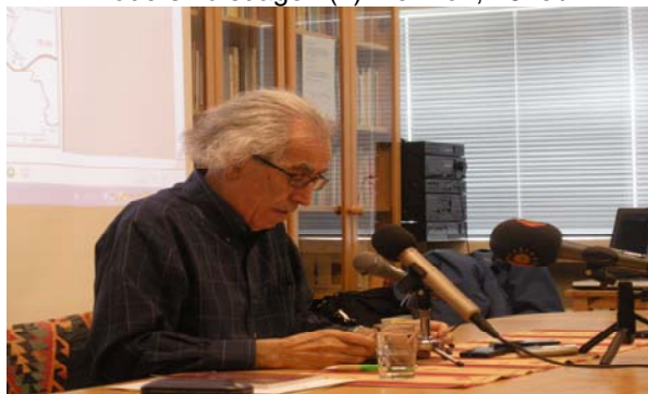
Språkpolicy i Kurdistan, 28 april