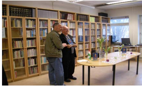
Modersmålsdagen (1), 18 feb.