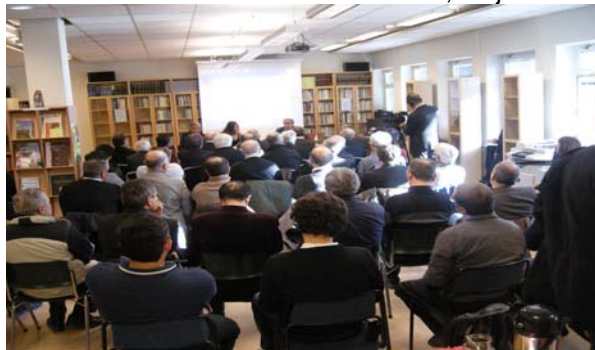
Modersmålsdagen (2): Lexikon, 26 feb