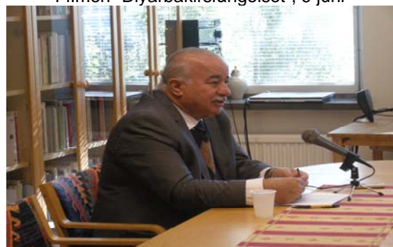
Litteraturen i södra Kurdistan, 15 sept