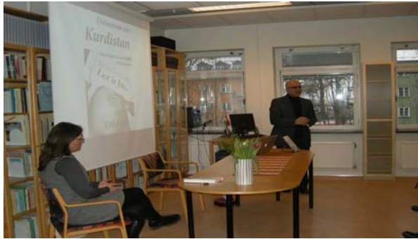
Boken "Drömmen om Kurdistan", 28 jan