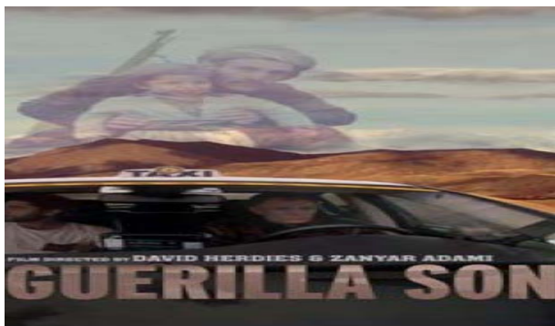
Filmen The guerilla son, 20 maj