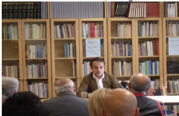
Kurder i Kazakistan, 7 okt