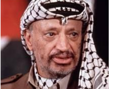
ياسر عەرەفات، سەرۆكى فەتحى فەلەستىنى

لەگەڵ پەيدابوونى بزووتنەوەى چەكدارى،يەكسەرسەركردەيەكى دىكتاتۆر دروست دەبنت و،خۆى بەسەر حىزبەكەدا دەسەپنننت. بەحوكمى ئەوەى ئەم بزووتنەوانە ، پەيوەنديەكى پتەويان بە جەنگەوەھەيە ، ھەمووكات دەنگى چەكەكان لە دەنگى قەلمەم و كتنب بەرزترە . ھەروەك چۆن ھەموو جەنگىكى پنويستى بە