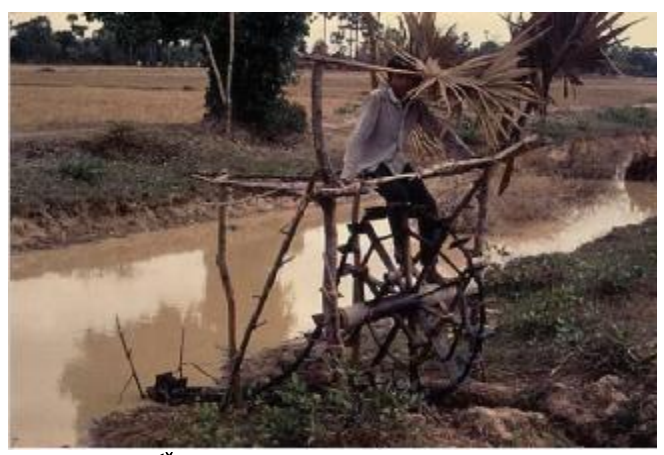
جووتياريکی کهمبۆدی بهم شيوهيه ئاووی کيلگهکهی دهدات.

جووتياران باشترين سووتەمەنىن بۆ جەنگى يارتىزانى . بەگشتى لهو وولاتانهی ، که جووتیاران لهخرایترین باری ئابووری و سیاسی وكۆمەلابەتىدا دەزنىن ، ىزووتنەوەي چەكدارى دروست دەيىٽت . يشتگوێ خستنی ماڤ وداواکانیجووتياران ، دەپێتە هۆی دروستبوونی بووركانى رق وكينهى جووتياران . ھەربۆيە لەو ولاتانەى ريفۆرمے، زەوى كراوەر بارى ژيانى جووتياران و لادى نشينەكان باشكرابنت ، بزووتنهوهي چهکداري تێدا روونادات .