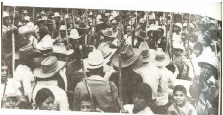
چەكدارەكانى ( بەرەى نەتەوەيى شۆرشگێرى گواتيمالا) URNG

گواتیمالا دەكەويتە ناوەراستى ھەردوو كیشوەرى ئەمەریكاوە. لە باكوورەوە مەكسیك و لە باشوورەوە ھندۆراس و ئیلسلقادۆر درواسییەتى. وولاتیكى زۆرجوان و خاكیكى زۆر بەپیتى ھەیە . ژمارەى دانیشتوانى دەگاتە 13.3 مليۆن كەس 20.