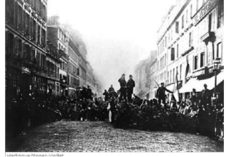
ساڵى 1871،پاريس لەكاتى كۆمۆنەى پاريسدا

لەپاش راپەرىنەوە ، ينك و پدك ، ھەرىەكە و خاوەنى مىلىشيايەكى سەربازى خۆيەتى. لەرىڭاى ئەم مىلىشيايانەوە، حوكمىزۆرەملىي خۆيانبەسەرخەلكىدادەسەپينن. لەھەموو شوينىكى جىھاندا ،كاتىك دەولەت بە عەسكەر بەرپوەبچىت، دەنگى نارەزايى لەناودەبرىت . ئىيمەلەپاش راپەرينەوە،ياساى كلاشينكۆقوئاربىجى،حوكماندەكات. كۆمەلگايەكى تەواو عەسكەرى لەم كۆمەلگا عەسكەريانەشدا ، كولتوورى عەسكەرتارى بەسەر كۆمەلگادا زال دەبىت و، كۆمەلگاى مەدەنى (پاش!) دەكەويت . لەكوردستاندا ، تەنھا ئەوە حاكمە ، كە خاوەنى مىلىشياى سەربازيە. تەنانەت حيزبە بچووكەكانىش ، ناچاربوون لەبەر ترسى ينك و پدك ، مىلىشياى عەسكەريان ھەبىت. دەبرد . دەتوانم بىيم مىلىشياى نەبوايە ، بە دەقەيەك لەناويان دەبرد . دەتوانم بىيم ، ئەم مىلىشيا گەريە ، خالى سەرەكى مانەوەى يىك و پدك بوو.