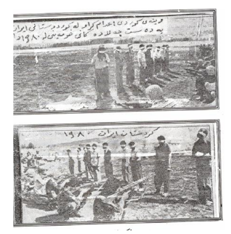
ساڵی 1980 رەمیکردنی شۆرشگێرانی کوردستانی ئێران بەدەستی رژێمی خومەینی و جاشەکانی

وەكوو دەشت و بيابانەكان نييە ، تا سووپا بەئارەزووى خۆى سووپاكەى دوژمنى لەناوبەريت . لەبەرئەوەى ناوچەى شاخاوى ودارستان وجەنگەلاەكان ، باشترين پەينى كيماياوين ، بۆ بەھيز بوونى ئەم بزووتنەوەيە .