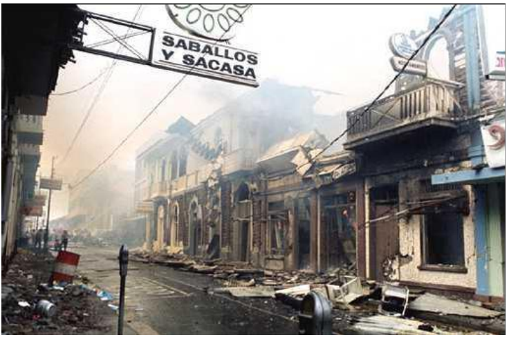
لەئەنجامى شەرى ساندىستەكان و جاشەكانى ئەمەرىكا Cotra لەوولاتى نىكاراگوا شارى Managua تووشى سوتاندن و ويرانكردن بوو

هەروەك لەپێشدا باسم كرد ، جەنگى پارتيزانى باشترين هەل دەداتە دەستى جەنەراللە خويناويەكان و، بە درىندەترين شيوە دەكەونە گيانى خەلكى سيقيل . جەنەرالل و سەركردەى بزووتنەوە چەكداريەكان ، ھەموو شتيك بەرەوا دەبيىن ، بۆ ئەوەى بەسەر يەكتريدا سەربكەون لەم جەنگە خويناويەشدا،خەلكى سيقيل گەورەترين قووربانين ھەمووكات حكومەتە سەربازيەكان ،سياسەتى