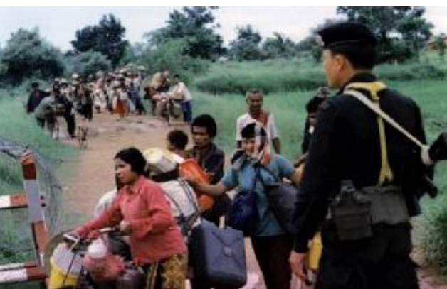
كۆرەوى كەمبۆديەكان بۆ ولاتى تايلاند

پاش شەریکی خویداوی له 15 ئەپریلی 1975 ، سووپای خمیری سوور بەیارمەتی (چین و تایلاند و ئەمەریکاو رۆژئاوا) ،Phnom Penh ی پیتەخت داگیردەکات و، رەسمیەن له سەرەتای سالی 1976 وە دەبیتە سەرۆک وەزیرانی کەمبۆدیا. حکومەتیکی درندەو سەربازیانه دادەمەزرینیت ، که دەبیته هۆی برسیکردن و راونان و ئاوەرەیی ملیۆنەها کەمبۆدی .حکومەتی خمیری سوور ، شیوه حکومرانیەک بوو، که زیاتر له ئەلمانیای نازی دەچوو .