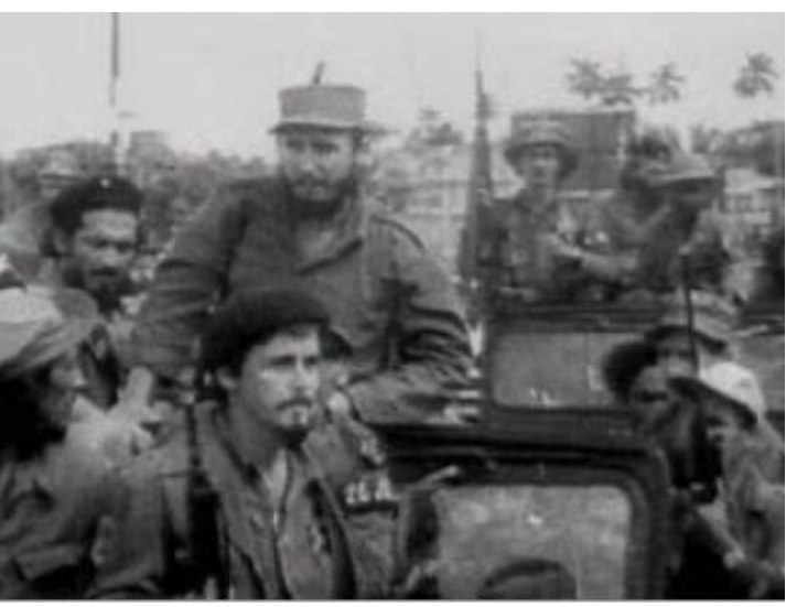
كاسترۆ و لەشكرەكەى لەكاتى داگىركردنى ھاڤاناى پێتەختدا

هیچ شارەزایەکی لەم بوارانەدا نەبوو ،ھەرئەمەش بووە ھۆی سەرنەکەوتنی لەھەردوو پۆستەکەدا . ئەمەش زۆر ئازاری دەروونی گیۋارای دا.