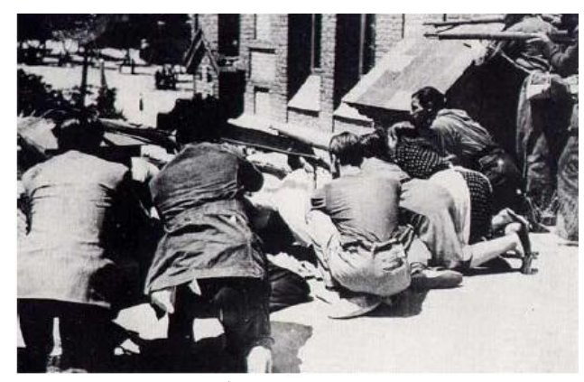
بارتيزانه ئيسپانيەكان لەكاتى جەنگى ناوخۆى ئيسپنيادا.

لەسالى 1936 شەرىكى مالويرانى وولاتە جوانەكەى ئىسپانياى گرتەوە. ئەم شەرە، مالويرانيەكى گەورەى بۆ خەلكى ئەو وولاتە ھينا . كاتيك فەرماندەى سووپاى ئىسپانى لە مەرۆكۆ ( مەغرىب) جەنەرال فرانكۆ*،لە 1936.06.17 دا،كودەتايەكى سەربازى بەسەر حكومەتى كۆماريەكان كرد 7.