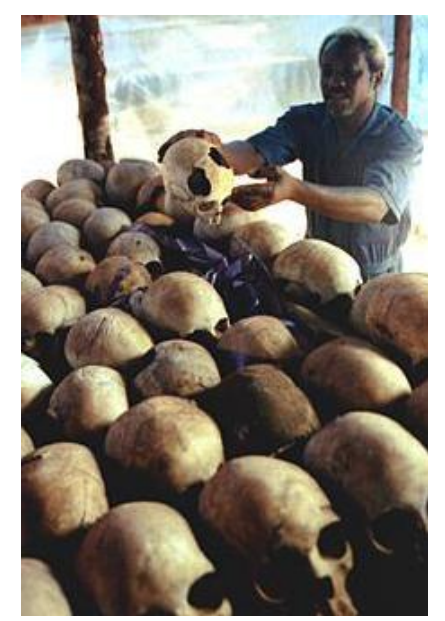
مۆزەخانەى كەلە سەرى مرۆڤ!!

لەسەرتاى سالى 1994 وە شەريكى خويناوى لەنيوان ھەردوو گرووپ يان ئىتنى (ھوتۆ و توتسى ) دەستى پىكرد . لەيەكەم مانگى جەنگەكەدا ، زياتر لە 300 ھەزار كەس كوژران. ھەموو جيھان لەم چەتەگريە سەرى دەرنەدەكرد . چۆن لەماوەيەكى ئاوا كورتدا ، ھىندە مرۆڤ دەكوژرىت . ولاتە زلھىز و گەورەكانىش ،وەكوو ئەوەى دىمەنىكى خۆش بىت و چىزيان لى وەردەگرت و ھىچيان نەكرد . ھەرچەندە ئەم شەرەش ئەوان بە ديارى بۆ خەلكى راوەندا ناردبوويان .