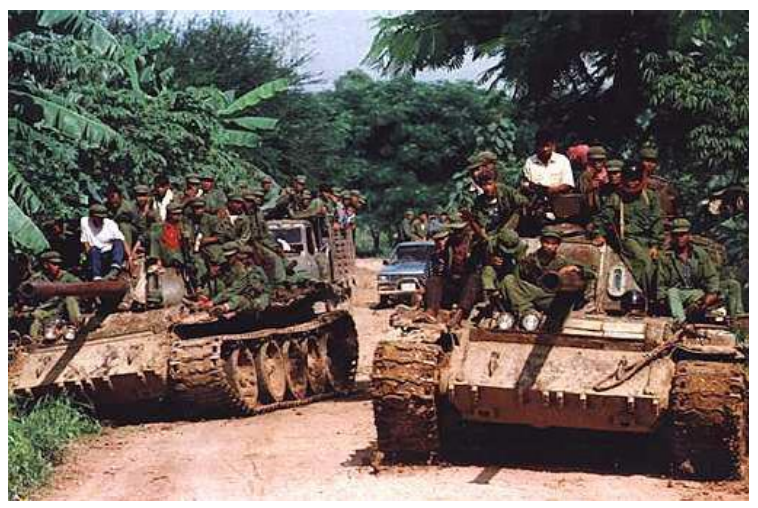
چەكدارەكانى خميرى سوور