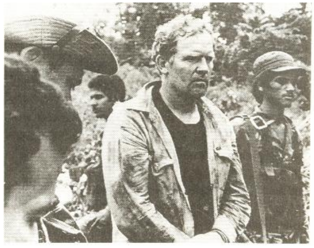
يەكێك لەپياوكوژەكانى لەشكرى كۆنترا

له سەرەتاى ھەشتاكاندا ئەمەرىكا سەرۆكىكى فاشىست و درىندەى حوكمى دەكرد،ئەويش رۆنالد رىگن بوو. ديارە ھەموو سەركردەكانى ئەمەرىكا بە گشتى حەزيان لە شەرو چەتەگەرى بووە ، لى ئەم سەركردەيان لەھەموويان زياتر ھەوادارى جەنگ و چەتەگەرى بووە . مەگەر سولتان و سەركردە تووركەكان و ھىتلەر و سەدام پەيان پىيردبىت ، دەنا كەسى تر پەى بەم سەركردەيە نەبردووە. ھەر بەھاتنە سەركاريەوە ، پلانىكى شەرى بى كۆتايى دانا . يەكىك لە پلانەكانى ، دروستكردنى كۆمەلىك حكومەتى دىكتاتۆرو سەربازى لە ئەمەرىكاى لاتىن بوو. لەگەل ئەوەشدا دروستكردنى لەشكرىكى تايبەتى پياوكوژ و جاش ، كە ئەركى لەناوبردنى ھەموو حكومەتىكى دىمۆكرات و كۆمۆنىست بوو . ئەم لەشكرە ، كە بە لەشكرە ( كۆماندۆى كوشتن )كۆنترا ناوبان دەركرد.