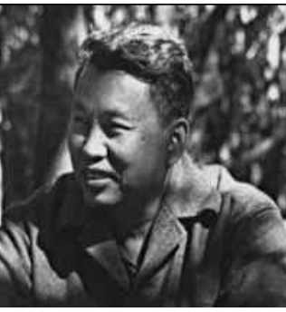
پۆل پۆت ، سەركردەى خميرى سوورى كەمبۆدى

_ پەيدابوونى سەركردەى دىكتاتۆر و حيزبى ناديمۆكراتى