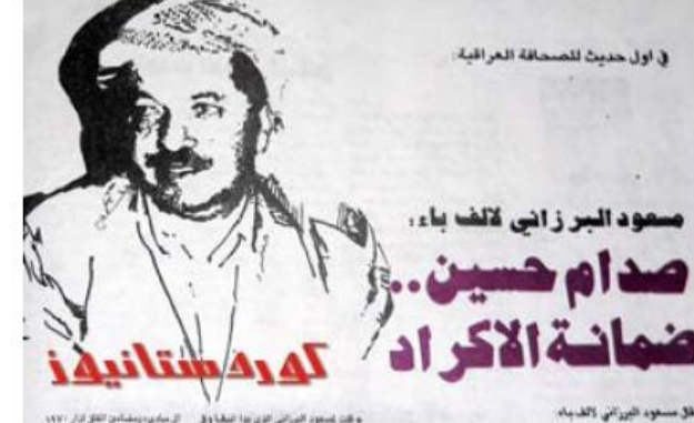
-إن الضّمانُ الأساسيَ والوّحيد للأكراد في اي الفاق هو السّيد الرئيس صدام حسين لأن سيادته هو اهم الضمانات لذا ويشكل حالة مطمئنة جدا لمطّلينا وحقوقنا

باشترین گۆرەپانی جەنگ بۆ بزووتنەوەی چەكداری ، لادى و ناوچە جەنگەڵ و شاخاويەكانە . چونكە لێرەدا دەتوانێت خۆى قايم بكات وشەڕ لەدژى حكومەت بكات . لەبەر ئەوەى بەگشتى بزووتنەوەى چەكدارى ناتوانێت لەگەڵ سووپاى نيزامى بجەنگێت ، چونكە لەرووى چەك و تەقەمەنى و ژمارەشەوە ، سووپاى نيزامى لە گرووپێكى بچووكى چەكدار بەھێزترە .بۆئەوەى شەريش لەگھڵ سووپايەكى بەھێزدا بكەيت ، پێويستە بەچەند شێوەيەك پارسەنگى خۆت رابگريت. تاكەرێگاش كەخۆت بەھێزبكەيت ،سەختىو ئاڵۆزى ئەوناوچانە يە كەشەرەكەى تێداروودەدات.چونكە شاخ ودارستانەكان