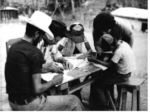
خويْندن له كۆلۆمبيا بەم شيّوەيە

بەگشتى تەنھا خەلكانى نەخويندەوار وناھۆشيارى سياسى ، دەكەونە دواى بزووتنەوەى چەكدارى . بۆنموونە سەير دەكەيت لەو ولاتانەى ،كەريزەى نەخويندەوارى تييدا كەمە ، بزووتنەوەى چەكداريش تييدا روونادات . لى بەگشتى ئەم بزووتنەوەيە لەو شوينانە يان ئەو وولاتانە دروست دەبيت ، كە ئاستى ھۆشياريان زۆر نزمەو ريزەى نەخويندەواريش زۆر بەرزە . بۆ نموونە ريزەى نەخويندەوارى لە كۆلۆمبىيا 8،73%،لە ئەفگانستانيش 78%. 14