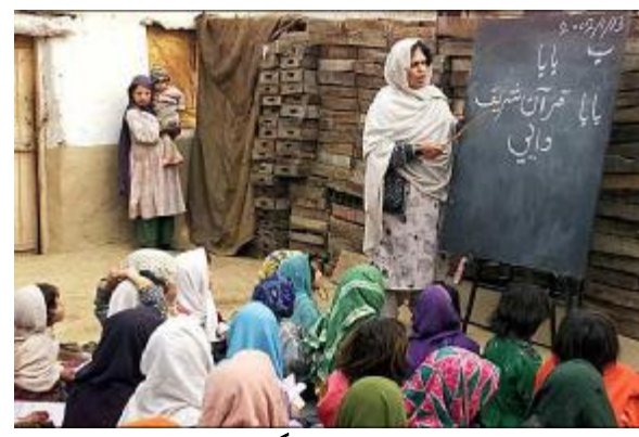
خوێندن له ئەڧگانستان

بهههمان شیّوه کریّکاران دهچهوسیّننهوه ، باشترین نموونهش کوردستان و وولاتی کووبایه .