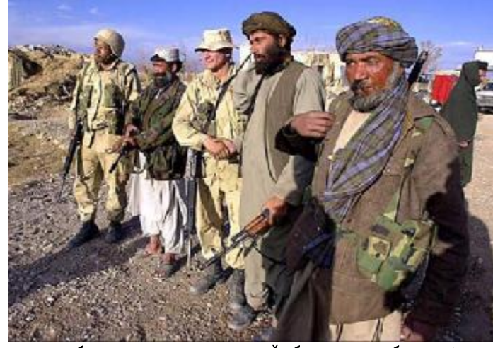
جاشه ئەفگانيەكان لەگەڵ سووپاى ئەمەريكاى داگيركەر

هەمووحاكمىكى دىكتاتۆر، پيويستى بەكۆمەلىك شاعىرونووسەر ھەيە، كەبەرگرى لە حوكمەكەى بكەن. ھەروەھا حكومەتىكى دىكتاتۆر، پيويستى بە دەزگايەكى گەورەى ئيعلامى ھەيە، بۆئەوەى راستيەكان لەخەلكى بشاريتەوەو، ھەرچى ناپاستىش ھەيە، بەراستى پيشانى خەلكى بدات. بەداخەوە بەشىكى زۆرى نووسەرانى كورد، نەيانتوانى خۆيان لە حوكمى ينك و پدك رزگابكەن. بەشىكى زۆرىشيان چوونەناودەزگائيعلاميەكانى،ينك و پدك رزگابكەن. بەشىكى خەواسوورى بەرلەشكرى ينك وپدك . ئەوان دەبوو پيش لەشكرى خەلكى بكەوتنايە و، ھەوليان بدايە خەلكى بۆ خۆپيشاندان و مانگرتن ھان بددەن. دەبوايە خەلكى لە زولم وزۆرەى ئەوان ھۆشياربكەنەوە. بەلام بەداخەوە ، بژيوى ژيان و ترسنۆكى و ھەلپەرستى ، رۆلى سەرەكى نووسەرانى كوشت. نووسەرانى كورد