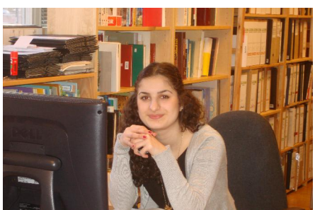
نه فین.. میوانی هه میشه یی کتیبخانه که

بێجگه له کتیبه، زیاد له ۶۰۰ گۆقارو رۆژنامه ی کوردی له به شی گۆقارو رۆژنامه کانی کتیبخانه ی کوردی هه ن، هه رچۆن گۆقاره کانی نیو ئینته رنیته له ماله پری کتیبخانه که دا بهر چاو ده که ون، هه روه ها ژماره یه کی زۆر له وتاری کوردی، یان نه وانه ی له سه ر کوردو کورده ستان نووسراون له کتیبخانه که دا وه ک نه رشیف پارێزاون و خوینه ر ده توانی کۆپییان بکات، به مه مان شیوه ژماره یه کی باش له به لگه نامه ی پارتو ریکخراوه کوردیییه کان، یان نه وانه ی په یوه ندییه کان به کورده وه هه یه له م کتیبخانه یه دا پارێزاون، له گه ل