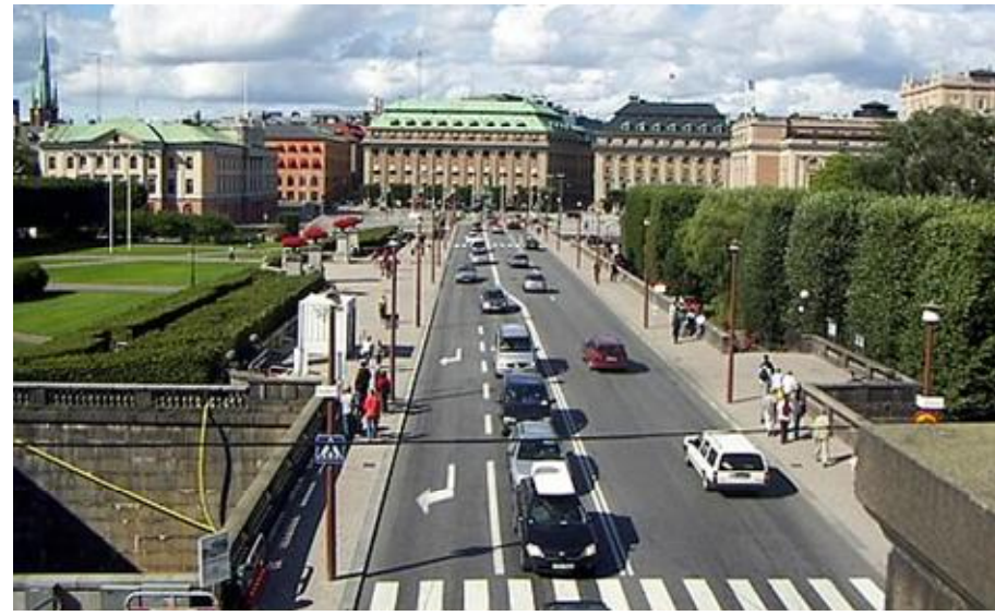
ستۆکهۆلم.. پایتهختی پر له جوانی و کتیبه و هونهر

کتیبه کان به پتی هه ندیک پۆلێنی تایهت له کتیبخانه دا ریزه بند کراون، کتیبه کوردیییه کان به پتی زاوه کانی (کرمانجی، کرمانجی خواروو، زازاو گۆرانی) پۆلین کراون. هه مو کتیبه کان به پتی باهت و به